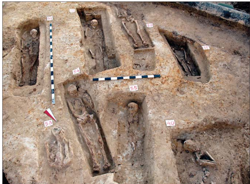
Захоронения из могильника на левом берегу Охты.

Согласно шведской хронике, флот с войском в количестве 1100 человек возглавлял королевский наместник Тергильс Кнутсон. По завершении строительства, как отмечает летописец, между двумя реками был вырыт ров, над ним стояла стена с восемью башнями с бойницами, а за ними — все войско. После отплытия флота в Ландскроне остался гарнизон численностью 300 человек.