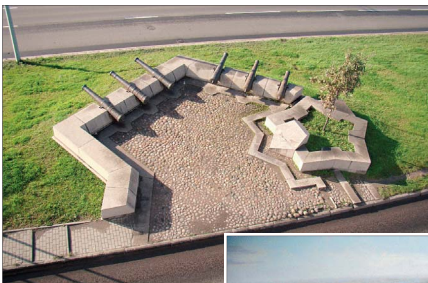
Памятный знак «Крепость Ниеншанц», 2000 г. Авторы Владимир Реппо, Петр Сорокин